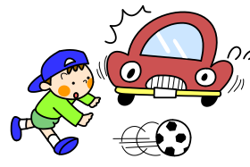
冬休みも 交通安全！！