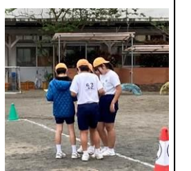
※ 1ポイントが20mで、コース1周で10ポイントです