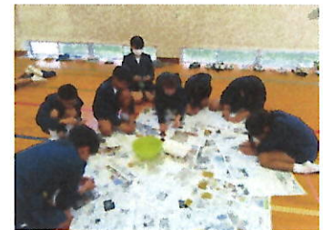
【卒業記念夜光貝製作】