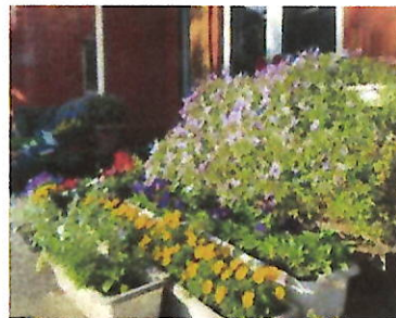
【新年度に向けて咲く花】