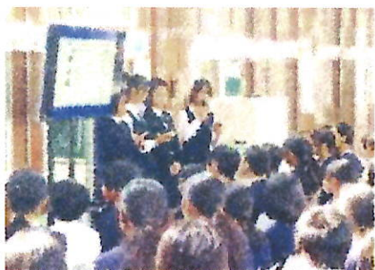
【平和学習（6年生：朝日小卒の高校生と）】