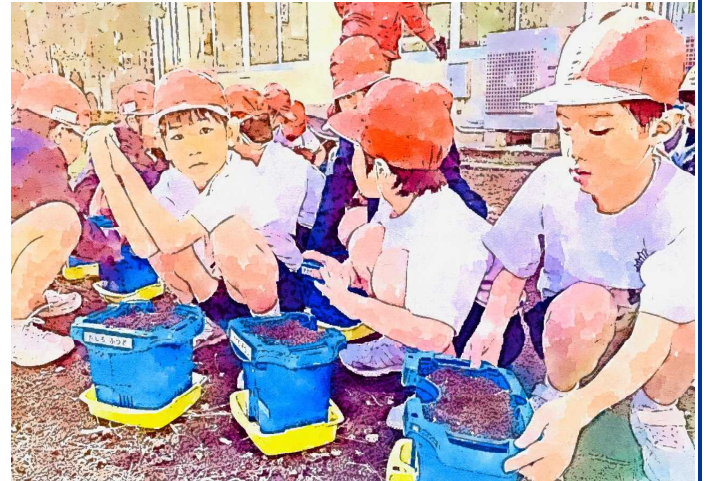
[チューリップ球根の植え付け(1年生)]

私たち大人は、子供の興味をもったことに寄り添い、親の話で補ったり、百科事典を準備しておき、写真や絵、文章などでより深く理解できるようにしたりしてあげることが大切ではないのでしょうか。ぜひ、お子様との親子の会話を楽しみながら子供たちの思考を広げる団らんを深めていただければと願っています。学校と家庭が連携し、児童一人一人を「光り輝く朝日っ子」に育てていけたらと思う日々です。