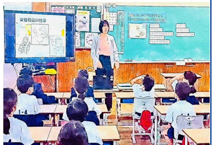
[栄養教諭による食育指導の様子(1年生)]