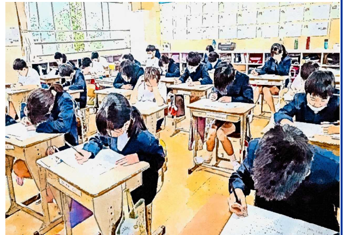
[鹿児島学習定着度調査受検の様子(5年生)]