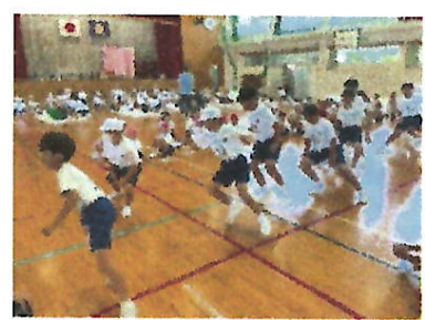
【体力テストに挑戦する姿】