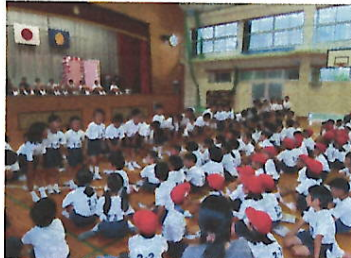
【1年生をむかえる会】