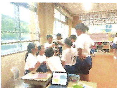
【討論で考えを修正する姿：5年】

今後もこのような姿が学校全体にあふれていくことを目指していきたいと思っています。