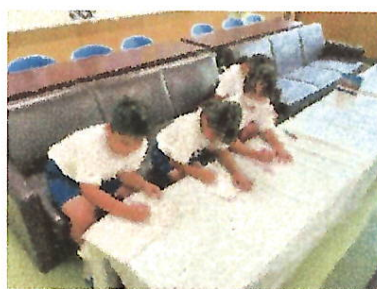
【校長室でインタビューする姿：4年】