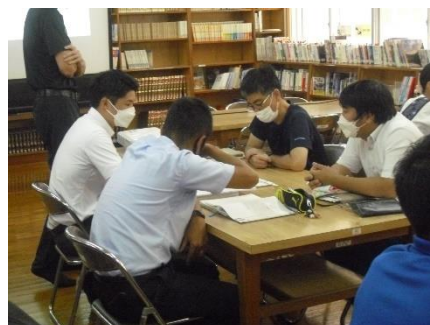
職員研修の様子 (教育課程編成)