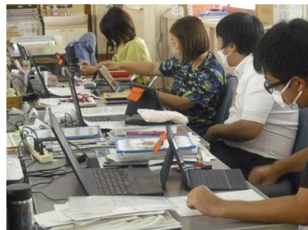
職員研修の様子 (GIGAスクール)

研修については、個人で自主的に取り組む研修(教育センターや奄美市が主催しているものなど)の他に、学校でも校内研修に取り組んでいます。夏休み期間中は、現在、推進しているGIGAスクール構想をより充実させるために授業における効果的な活用法や来年度の教育課程編成についてどのように進めていくか等の研修を深めました。先生方も子どもたちのために研修に励んでいます。