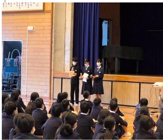
生徒会からの説明の様子

緊張した感じの6年生でしたが、生徒会からの説明が始まると表情が和らぎ、中学校生活への期待がみられました。短い時間での説明会になりましたが、期待に胸をふくらませて元気に入学してほしいと思います。4月の入学を頼りになる先輩や素晴らしい先生方と一緒に楽しみにしています。