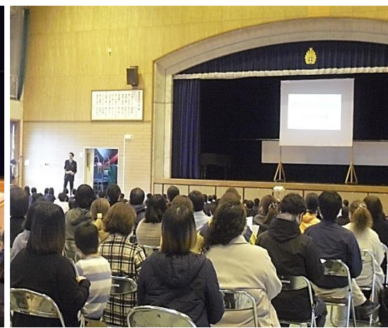
新入学生学校説明会の様子