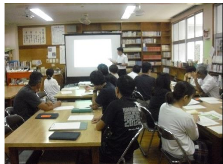
職員研修の様子 (学力向上)

研修については、個人で自主的に取り組む研修(県総合教育センターや奄美市が主催しているものなど)の他に、学校でも講師を招き校内研修に取り組んでいます。夏休み期間中は、学力向上のための手立てをより充実させるための授業における効果的な指導方法の研修、消防の方を講師に招いた非常時の救急救命の研修、高等学校より講師を招いた進路の研修等を行い、知見を深めました。先生方も子どもたちのために研修に励んでいます。