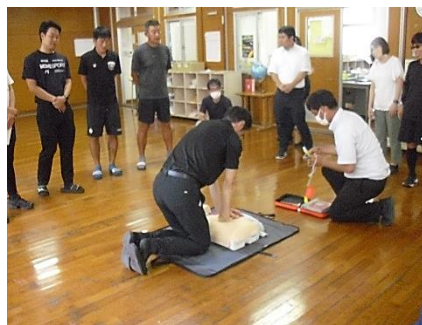
職員研修の様子 (救急救命・進路)