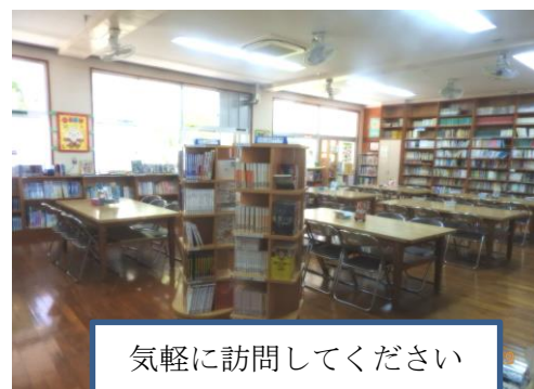
気軽に訪問してください

本校の図書室は、今年度から保護者への本の貸し出しを実施しております。学校を訪問される時は、子どもと一緒に図書室に寄っていただき、本を借りていただければと思います。