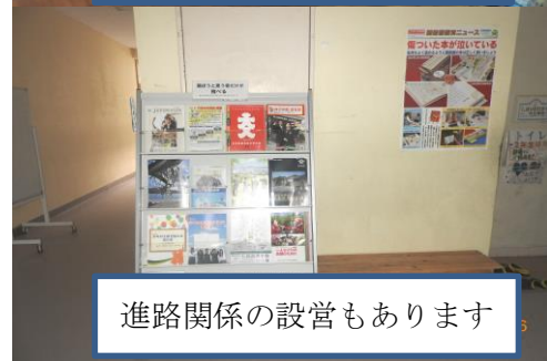
進路関係の設営もあります

図書室では、係活動はもちろん、ボランティアの生徒も頑張っています。ありがとうございます。