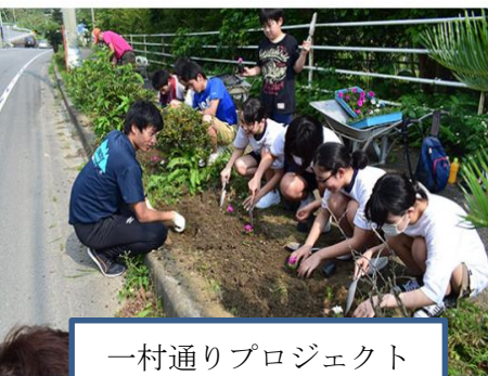
一村通りプロジェクト