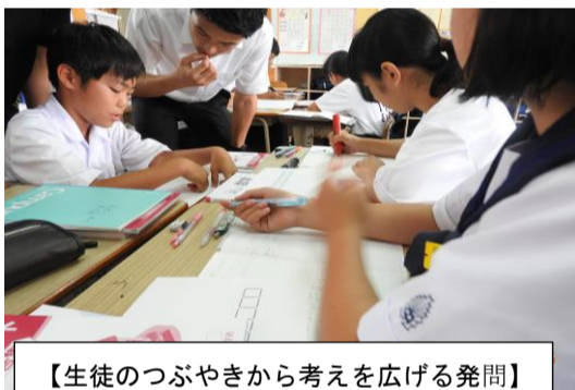
【生徒のつづやきから考えを広げる発問】