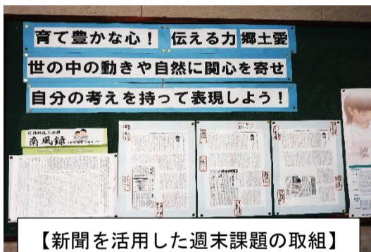
【新聞を活用した週末課題の取組】