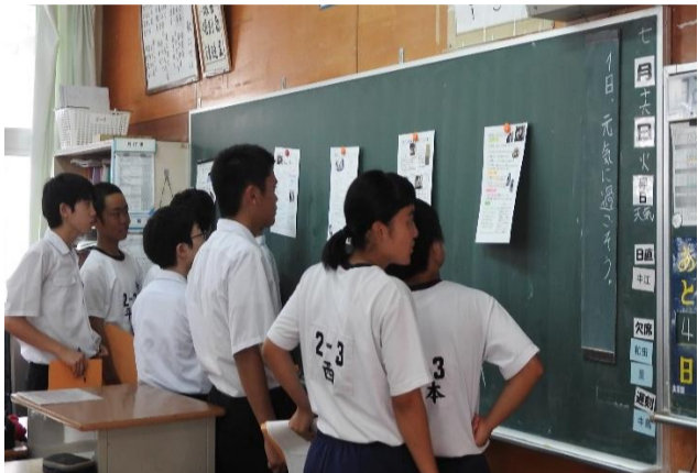
【職場体験学習の職業まとめ】他から学ぶ