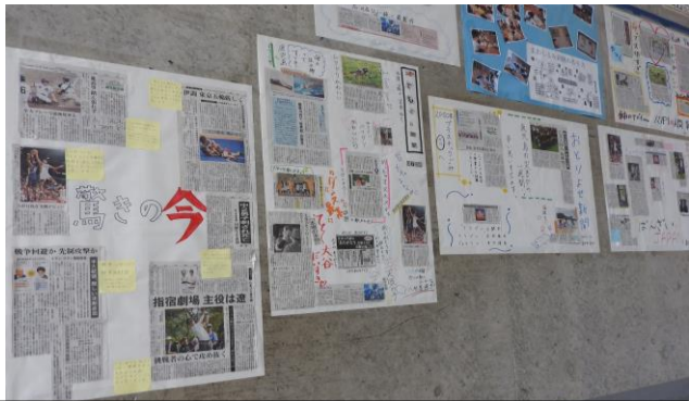
【よむのび教室で作成した新聞】3階設営

さて、夏休みが始まります。与えられた課題は、宿題になります。自分が興味のあることや体験して感じたことのすばらしさを自由研究や調べ学習、読書などとして取り組んでください。夏休みの活動がこれからの生き方につながるといいですね