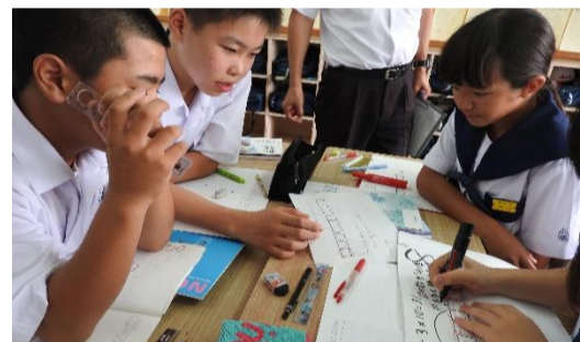
【フレッシュ研修授業 班でのまとめ】