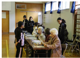
【デッショ会の皆様との交流】

1月13日(土)にシマグチカルタ大会を実施しました。今年度は、芦花部の「デッショ会」の方々12名に協力していただきました。