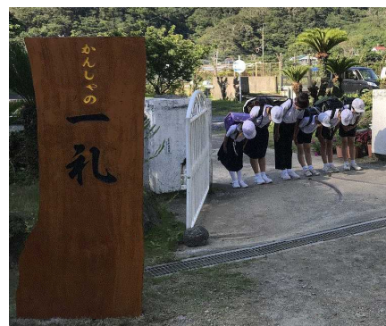
立派な『一礼』の看板

これまで正門前にあった『一礼』の看板が劣化し、修復不能となりましたが、高田興業様のご寄付により、立派な『一礼』看板が設置されました。先輩の意志を受け継ぎ、芦花部校伝統の挨拶を、これからも継続してほしいと思ひます。