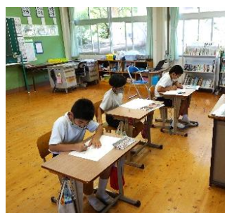
【5・6年生の制作の様子】