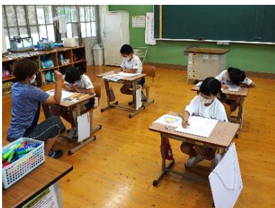
【3・4年生の制作の様子】

6月8日(火)にスケッチ大会を実施しました。1・2年生は, 学校で遊んだことや授業で活動したことなどを描き, 3年~6年生は, 港, 船こぎ, エイサー, 授業での活動など思い思いに楽しく描いていました。子供たちの個性あふれる作品が仕上がるのが楽しみです。