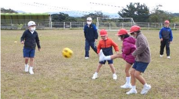
【全体レクリエーションでのサッカーの様子】