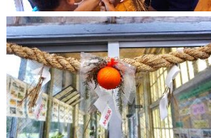
【しめ飾り作りの様子】