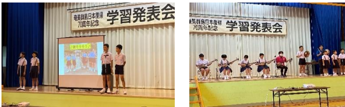
【全児童による三味線や太鼓での発表や5・6年発表】

11月11日（土）に学習発表会を実施しました。「くじらぐも」の劇や、授業で学習したことや総合的な学習の時間に調べたことをタブレットでまとめ発表しました。5・6年生は、英語でのスピーチで紹介をはじめ、奄美の食文化や農業などについて、タブレットを使って発表しました。また、音楽発表会で披露した、「行きゆんにゃ加那」「稲すり節」「ワイド節」を保護者の方や地域の皆様の前で発表することができました。更に、愛の浜園さんとコラボした歌や踊りも入り、充実した学習発表会になりました。保護者や地域の皆様、多くの方々に来場いただきありがとうございました。