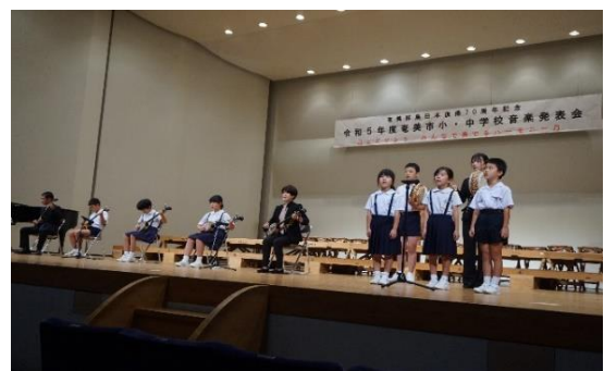
【音楽発表会の様子】

11月8日（水）に、市音楽発表会が川商ホールで行われました。本校は、全校児童が参加して、三味線や太鼓を使い「行きゅんにゃ加那」「稲すり節」「ワイド節」の3曲を演奏し、会場いっぱいに太鼓と三味線の音色が響き渡りました。奄美群島日本復帰70周年にふさわしい郷土色豊かな演奏にたくさんの拍手をいただき、子供たちの自信へと繋がりました。