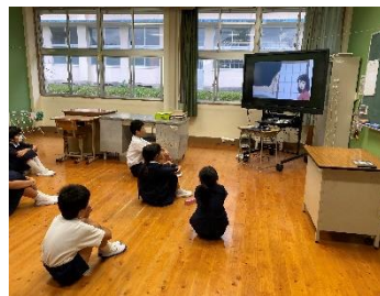
【DVD「めぐみ」を視聴している様子】