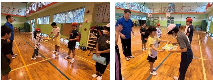
【寄せ書きのプレゼント】

お別れ遠足の出発の前に、体育館で5年生2人と3年生1人が中心となって企画した6年生を送る会を行いました。サッカーとバスケットボールを6年生と一緒に楽しみました。最後に、6年生へのお礼の言葉と寄せ書きのプレゼントもあり、みんなの心がこもった素敵な「6年生を送る会」となりました。