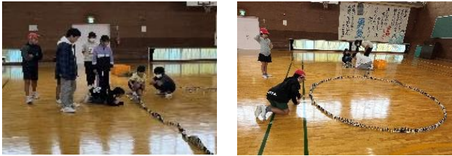
【ドミノ倒しの様子】

3月1日（金）にお別れ遠足を実施しました。奄美少年自然の家に行き、みんなでドミノにチャレンジし、その後はバトミントンやバレー、キャッチボールなどをして楽しみました。全校児童で楽しい時間を過ごすことができたお別れ遠足となりました。