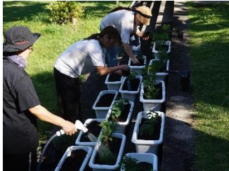
【保護者と一緒に花植え】

かごしま国体の開催に向け、花いっぱい活動の取組を行いました。これは、大会の開・閉会式会場や競技会場、道路、その他周辺地域等を花でいっぱいにし、来県する方々をおもてなしする取組です。