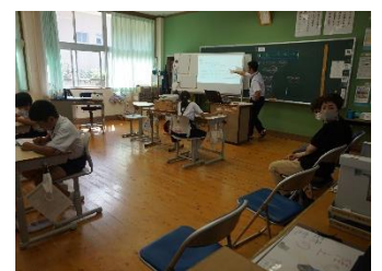
【5・6年の授業の様子】

9月14日（木）、2学期最初の授業参観がありました。今回は、どの学年も算数の学習でした。2学期は更に学力の定着と向上を図っていききたいと思います。