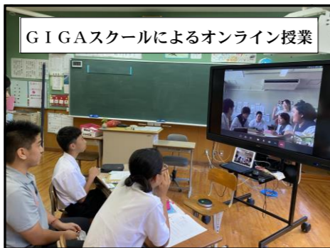
GIGAスクールによるオンライン授業

昔はなかった学習が新しく行われています。未来に輝く子どもたちのために、今、教育現場は大きく変わってきています。