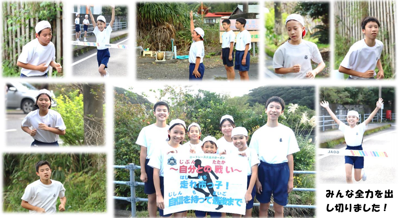
みんな全力を出し切りました！

10日(土)、校内ロードレース大会が行われました。朝から雨が降り開催が心配されましたが、そこはやはり市の子どもたち。開会式には晴れ間も広がり、子どもたちのがんばりを祝福してくれました。いよいよ本番。中学男子5.0Km, 小学6年男子3.0km, 小学5,6年女子2.0Km, 小学4年1.5Km, 小学2年1.0Kmのコースで、全員がそれぞれのコースを見事完走することができました。終わりごろに降り出した雨の中でも、最後まで子どもたちに向けられた、保護者や集落の方々からの温かい声援も後押しし、子どもたちの一生懸命に走る姿に元気づけられる、素晴らしいロードレース大会となりました。試走から本番まで、応援と交通整理本当にありがとうございました！