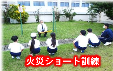
火災シヨート訓練