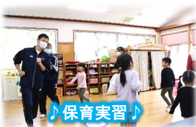
♪ 保育実習 ♪