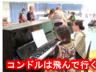
コンドルは飛んで行く