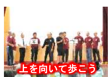
上を向いて歩こう