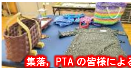
集落、PTAの皆様による作品の数々(たくさんの出品、ありがとうございました)