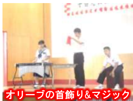
オリーブの首飾り&マジック