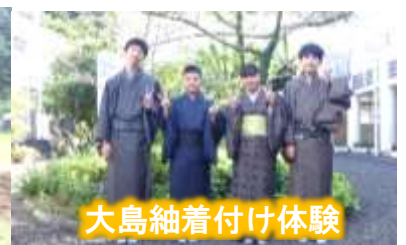
大島紬着付け体験