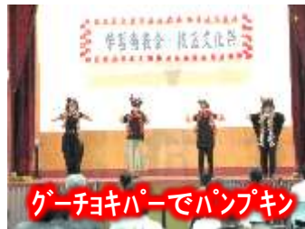
ゲーチャキパーでパンプキン