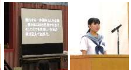
弁論・英語スピーチ発表