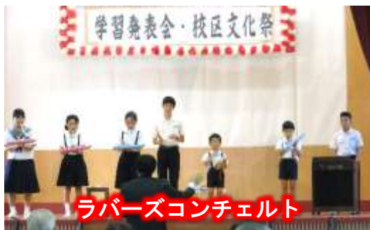
ラバーズコンチェルト