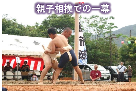
親子相撲での一幕

4年ぶりに開催された豊年祭・敬老祝賀会に、子供たちも参加しました。相撲やエイサー、各組々の出し物、八月踊りなど、様々な形で集落の皆さんと一緒にふれあう機会となりました。ありがとうございました!