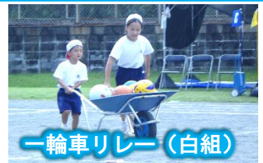
一輪車リレー (白組)