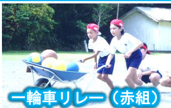
一輪車リレー (赤組)

児童生徒だけでなく集落の皆さんも一緒になった入場行進、そして4年ぶりのエール交換。赤・白互いにエールを送った後は、市集落全体にエールを送りました。競技でも子供たちはもちろん、集落の方々も真剣に、そして楽しく参加してくださいました。また輪回しや、グランドゴルフには来賓の方々にも飛び入りで参加していただき、大いに会場が盛り上がりました。1学期から練習に取り組んできたエイサーも元気いっぱい披露できました。最後は校庭全体を使って「あまださがりや」「浜千鳥」「六調」を踊り、奄美群島日本復帰70周年記念大会にふさわしい、大盛況のうちに終了しました。