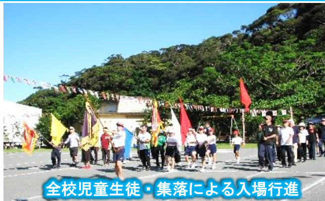
全校児童生徒・集落による入場行進