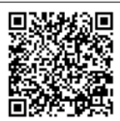
【カードの二次元コード】

相談機関の紹介です。 1号棟掲示板にも掲示していますのでご覧ください。あわせて、学びポケットへ市の相談窓口もアイコンを作っています。