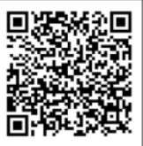
【ポスターの二次元コード】