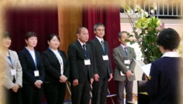
児童代表の言葉 6年