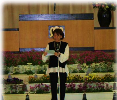
新生保護者代表あいさつ 様