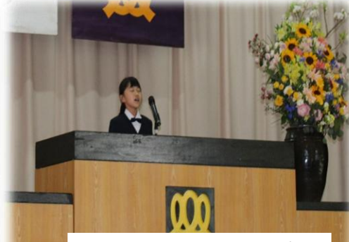
児童代表歓迎の言葉 6年