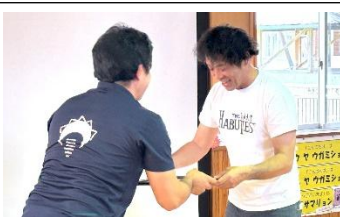
PTA 総会: 感謝状贈呈

【お詫び】4月からカラープリンターが故障中のため、白黒での印刷となっております。HPではカラーでご覧いただけます。