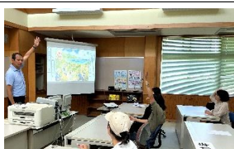
講話: AI時代と家庭の成長戦略