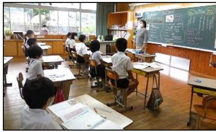
< 3・4年生の道徳 >