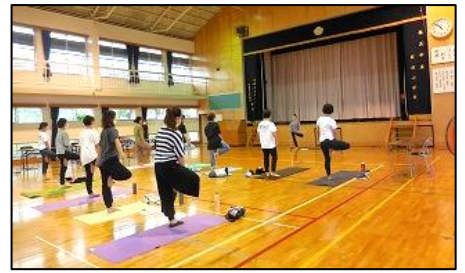
< 学校保健委員会 >