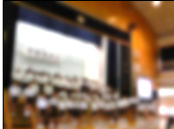
11/1～7 自由参観 11/11 学習発表会