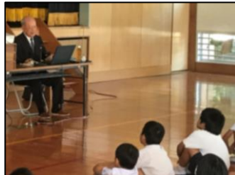
10/20 給食試食会 11/2 日本復帰歴史講話