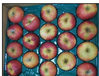
群馬県みなかみ町新治小より