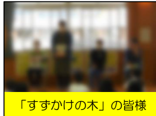
「すずかけの木」の皆様

また、5月11日(木)には2～6年生を対象に体力テストを実施しました。笠利小学校では、児童の実態から一校一運動を「かけ足(4～11月)・縄跳び(12～3月)」としています。体力テストの結果については学校保健委員会等でご報告いたします。