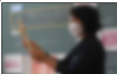
食に関する指導(3・4年)