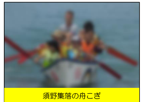
須野集落の舟こぎ