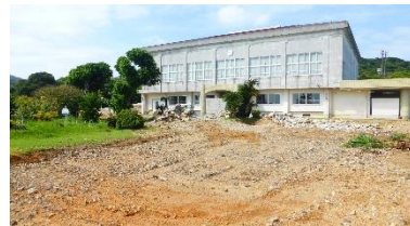
文責： 校舎も管理棟・理科室棟・技術室棟が解体され無く、寂しさを感じている傘田

9月号 令和元年9月27日(金)発行 〒894-0622 奄美市笠利町大字笠利 1924 番地