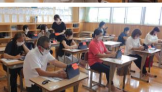
学級PTA 上から1年、2年、3年