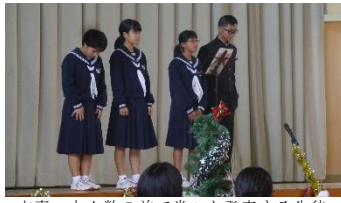
文責：大人数の前で堂々と発表する生徒の姿にいつも感心・感動している牟田