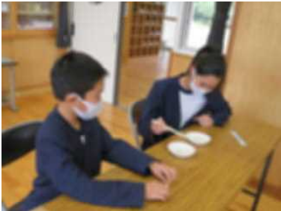
豆うつし大会の様子

1月18日(月)～22日(金)は、学校給食週間でした。児童に地域の特産物や郷土料理、産業に関心を持たせ、自らの健康管理や感謝の心を育む健康教育を推進していくことをねらいとしています。期間中は、安心安全な地元の食材を活用した給食メニュー、栄養教諭による給食指導、図書委員会による読み聞かせ、豆うつし大会など学校給食に関する取組を行いました。これらの活動を通して、子供たちは、食に関する多くのことを学ぶことができました。