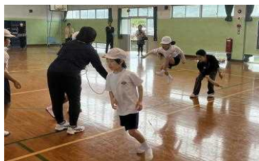
心を一つに 八の字跳び160回成功

練習の時の最高記録は157回だった八の字跳びは、大会時は160回の新記録でした。半数が1・2年生という本校ですが、10人の全校児童で声を掛け合いながら心と力を合わせて跳ぶことができました。