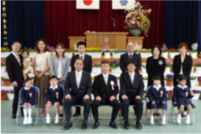
小学校4名の入学生

転入教職員は3名、転入生が6年生に1名ありました。教職員18名、児童数31名、生徒数17名でのスタートです。よろしくお願いいたします。