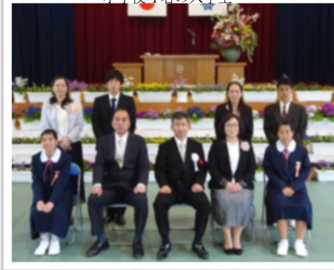
中学校は女子2名の入学生