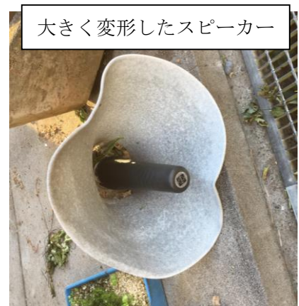
大きく変形したスピーカー

さて、学校では竜巻が発生したようです。東から西へ通過した跡が残っています。竜巻はバックネット横の放送用スピーカーを引きちぎり、上空高く巻き上げられたスピーカーは、校舎 3 階の図書室の窓を突き破り、図書室内で暴れた後、また別の窓を突き破り出て行ったようです。大きく変形したスピーカーは校舎の反対側の職員駐車場に落ちていました。図書室内は割れたガラスの破片と本が散乱し、廊下側の入り口のドア 4 枚も飛ばされていました。図書室のワイヤー入りの窓ガラスの破片は道路側にも多く落ちています。また、竜巻は老朽化した別棟、美術室の屋上のコンクリートを巻き上げ、最長 50cm 角のものまで 20m あまりも飛ばし、円形状に散乱したコンクリート片は向かいの学童クラブ使用の教室の窓を 10 数枚突き破りました。学校横の分譲地にあったプレハブの事務所は 50m あまりも転がされ、美術室屋上から見た景色が、竜巻の恐ろしさを物語っていました。聞くところによると、数年前にも竜巻が発生し、学校近くの家屋が損傷を受けたそうです。周囲を山に囲まれた平地、竜巻が発生しやすい環境にあることは間違いありません。大自然の脅威には勝てないとはいうものの、どう備えるのか、大きな課題が残ります。