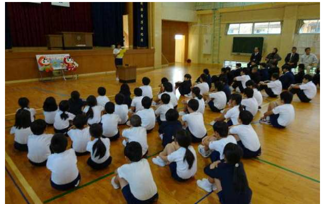
【12/5「人権の花」運動閉校式】

明日から、冬休みです。我が子の健全な成長に見通しをもち、保護者として毎日の子供との関わりを大切にしてお過ごしを願っています。それぞれご家庭のご都合もおありでしょうが、できるだけ地域行事等には参加させるようご理解とご協力をお願いします。