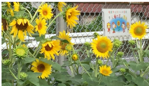
ひまわりのように真っ直ぐに伸びて欲しい

さて、多くの行事が目白押しだった2学期も今日で終わりです。夏休みが明けて残暑の中にはじまった運動会の練習、息つく間もなく文化祭の準備が始まり、慌ただしい中にも充実した2学期だったと思います。苦しかったかもしれないけれど、子供たちはそのひとつひとつの活動を乗り越えていくことで成長していきます。その苦しさを乗り越えるためには、子供の心の健康が不可欠です。家庭のあるべき姿が重要となります。子供にとって一番安心感がある場所は家庭です。家庭で保護者の温かい愛情を受け、子供は心のエネルギーを満たすのです。エネルギーが満たされた子供は学校でも意欲的です。前向きで何事にもよく頑張ります。自分を大切にしようとするとともに、友だちをも大切にします。何よりも自信のある行動ができます。一方、エネルギーが満たされない子供は朝から元気がなく、全てに自信と意欲が感じられません。人のせいにしがちで、友だちとのトラブルも起こしがちです。