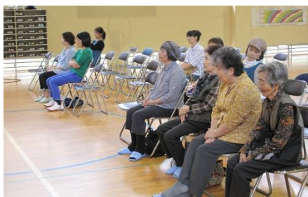
地域の方も来てくださいました

わたしたちも今後に活かせるようにするために、日常会話を中心とした簡単なシマグチを学ぶとともに、何か一曲でもシマ唄を歌えるように、また八月踊りも一曲は歌いながら踊ることができるように、土曜授業等で学習を深めていきます。五月十四日（土）の九時四十五分からです。保護者の皆様も是非ご参加ください。