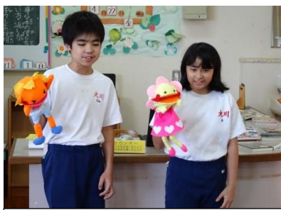
ハレハレとハナハナを使って 分かりやすく説明する児童

係の児童や先生方が、一年生にも分かりやすい説明をしてくれたので、その日から一年生も借りることができるようになりました。