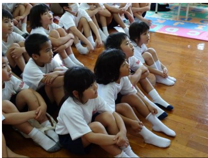
きちんとした姿勢で説明を 聞くことができました