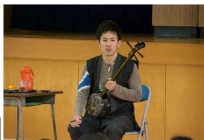
歌い方の違いに気がついた？