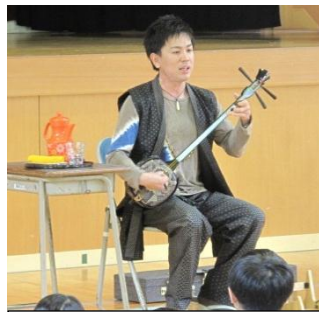
同じシマ唄でも地域によつて 歌い方は異なります