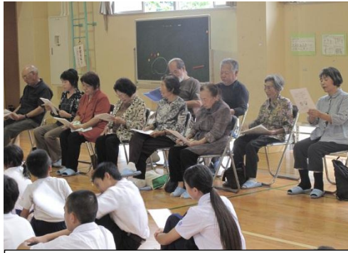
先月の学習の様子です

先月も書いたとおり、シマグチは日常会話の中で少しでも使うようにしていかないと、なかなか身につけません。毎回テーマを決めて学習していきますので、過去二回に参加していらっしゃらなくても全く大丈夫です。是非、子どもたちと一緒に学習をしていきましょう。