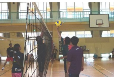
男性はジャンプしてのスパイクはできません