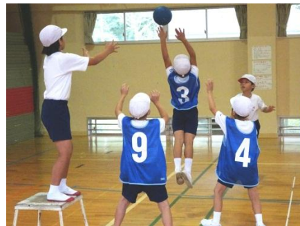
ポートボールを楽しみました