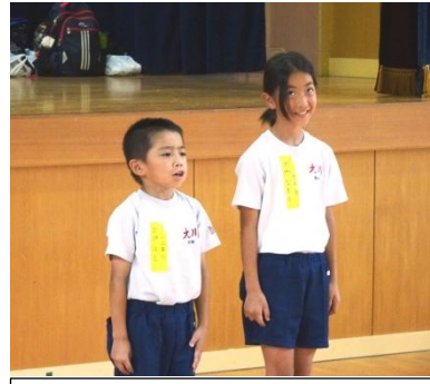
本校の2人が司会をしました

最初は、少しきこちないところもありましたが、すぐに打ち解けて楽しそうに過ごしていました。