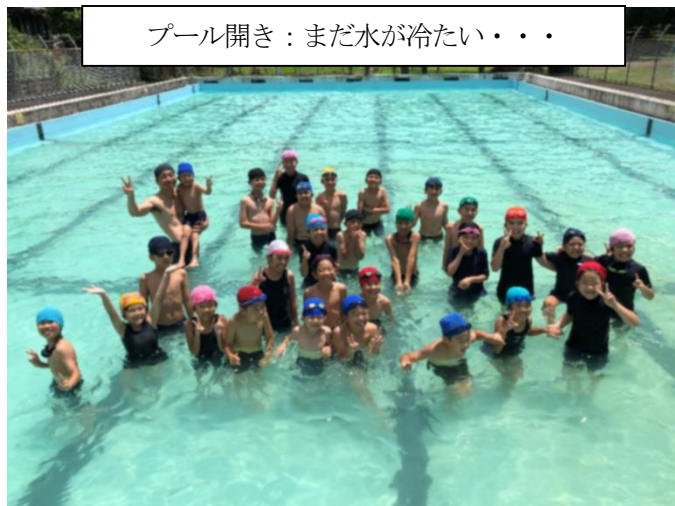
プール開き：まだ水が冷たい・・・