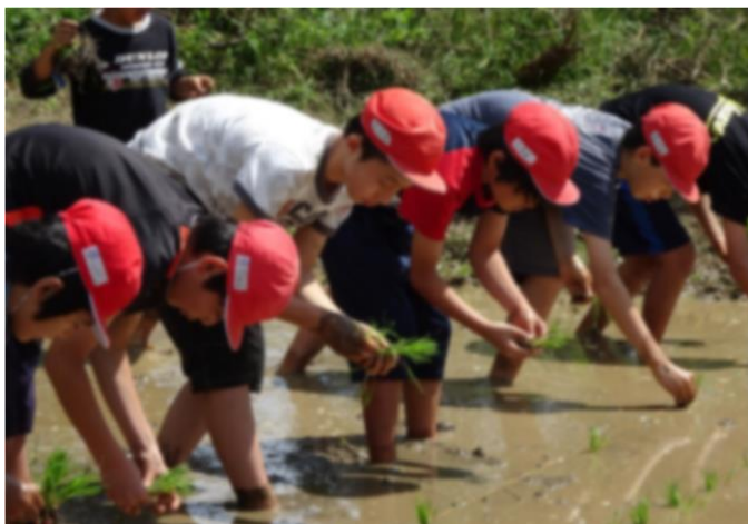
田植え：今年も黒米栽培に挑戦！収穫が楽しみです。