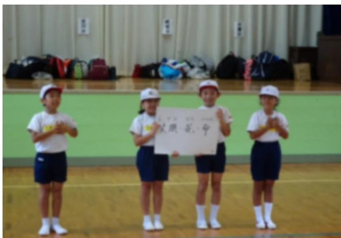
知根小で5校集合学習。大川小をアピールしました。