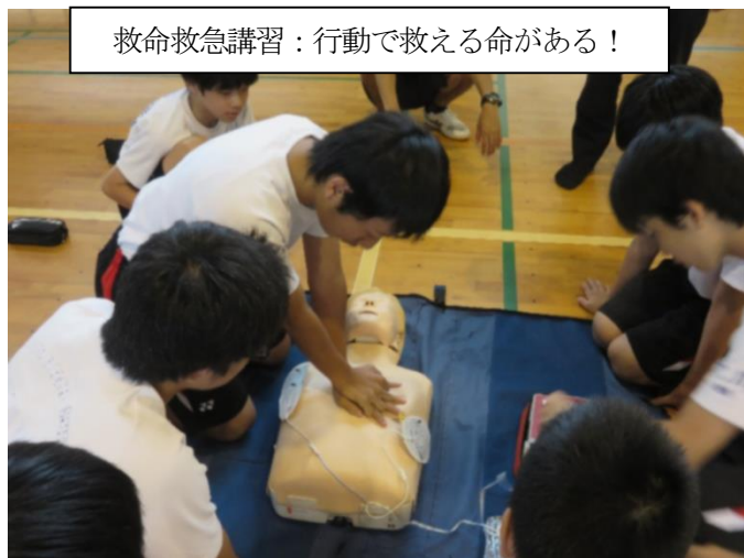
救命救急講習：行動で救える命がある！