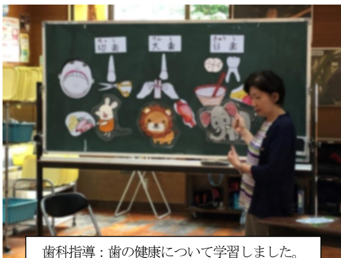
歯科指導：歯の健康について学習しました。