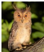
リュウキュウコノハズク