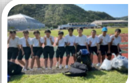
男女ともに大健闘！最後まであきらめずに全力を出し切りました！