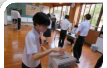
これからの大川中を担う、大切な選挙を実施しました。結果は後日！