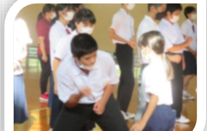
小中全員で交流学习！今年度2回目の交流学习でした。