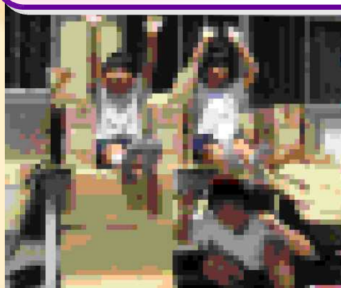
3・4年生 段ボールの家を作ったよ！