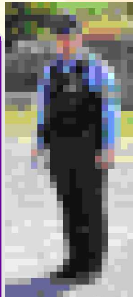
4月から笠利派出所に来られた○○巡査部長さん。子供達にも優しく声をかけて下さいます。