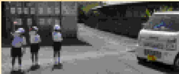
↑交通安全教室 上手に確認, 2年生!

交通事故や自然災害等、私たちを取り囲む様々な危険。そんなものから絶対に自他の命を守りきるのに必要なのは「経験(訓練)に基づいたとっさの判断と行動力」。そのために学校では年間を通して様々な訓練をしています。交通安全はもちろん、どんなときでもどんな場所でも、もし1人であっても、自他の命を守るために、お家や集落にいるときに災害が起こったらどうするか、ぜひご家庭でルールや約束を決めて、練習しておきましょう。