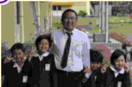
2・3年生「教頭先生、教頭先生をクビになったから担任になったの？」