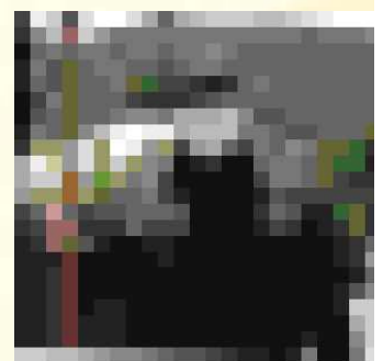
学校に不審者が来たら? (〇〇さんです!)