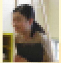
調査に来られた 〇〇さん

<上段右から> 〇〇〇〇さん 〇〇〇〇さん 〇〇〇〇さん 〇〇〇〇さん 〇〇〇〇さん 〇〇〇〇さん 〇〇〇〇さん