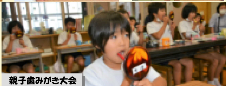
親子歯みがき大会

※裏面に安全マップを掲載しました。お気付きの点がございましたら、教頭までお知らせ下さい。