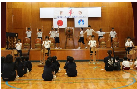
【 三太郎太鼓 】