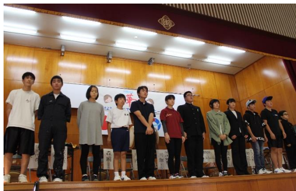
【 島口劇 】