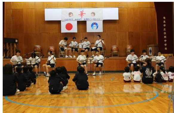
【 三味線演奏 】