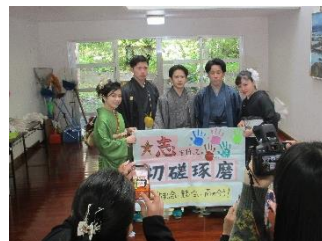
【中学時の作品を持って記念撮影】

1月3日住用町で成人式が行われ、今年成人になる卒業生が式の後、住用中学校を訪れました。