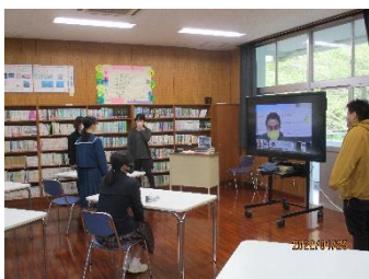
【オンラインでの授業の様子】