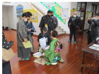
【タイムカプセルの中身を確認】