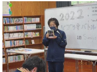
【あいさんの本の紹介】

1月20日（木）住用中学校ビブリオバトルを行いました。ビブリオバトルとは京都大学から広まった輪読会・読書会で「知的書評合戦」ともよばれているものです。住用中学校では昨年度から行っています。