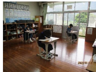
【鹿児島学習定着度調査の様子】

新型コロナウイルス感染症拡大防止のための臨時休業で1週間遅れた始業式を1月17日（月）に行いました。例年なら始業式の後、大掃除などをしていますが、今回は2時間目からすぐ授業を行い、2年生は鹿児島学習定着度調査対策、3年生は実力テスト対策を行いました。1年間の総まとめで進級、進学の準備である3学期が始まりました。