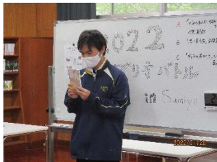
【権斗さんの本の紹介】