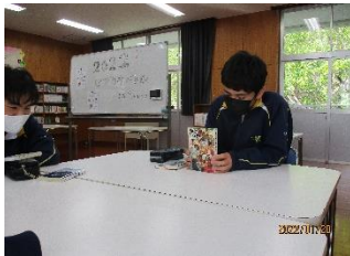
【グループでの本の紹介】