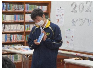
【幸天裕さんの本の紹介】