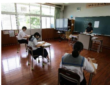
【3年生の調査の様子と問題用紙】