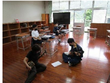
【三味線練習の様子】