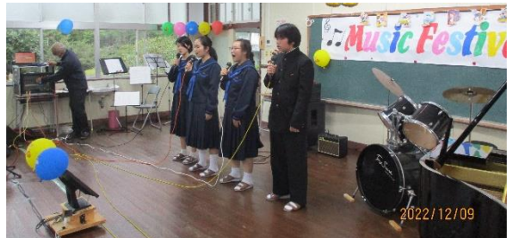
【1年生の合唱「ベストフレンド」】