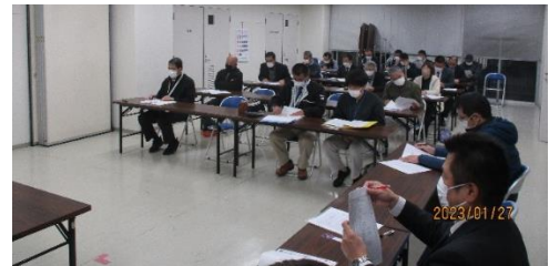
【活発な意見交換が行われました】