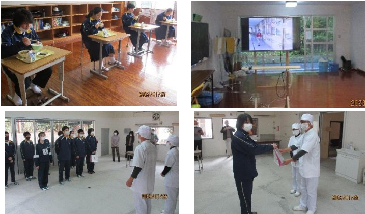
【記念品贈呈など給食週間に様々な活動を行いました】

1月23日(月)～27日(金)「鹿児島をまるごと味わう学校給食週間」の活動を行いました。給食が準備される様子を視聴したり、給食や食にまつわる校内放送を給食の時間に行ったり栄養教諭・給食センターの方々へお礼の言葉をつづった日めくりカレンダーの作成と贈呈を行ったりしました。