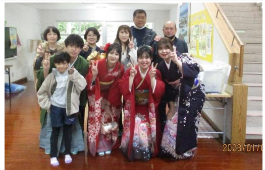
【二十歳の卒業生と家族で記念写真】

1月3日(火)奄美市で二十歳のつどいが行われ、今年二十歳になる卒業生の4名が母校の住用中学校を訪れました。