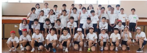
【4校合同での記念撮影】