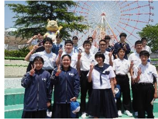
【グリーンランドを目一杯楽しみました】