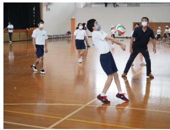
【交流を深めたソフトバレーボール】