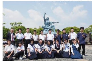
【平和公園・原爆資料館・如己堂等で平和学習を行いました】