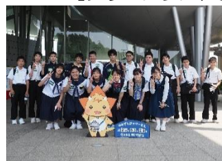
【宇宙科学館ゆめぎんがで科学体験しました】