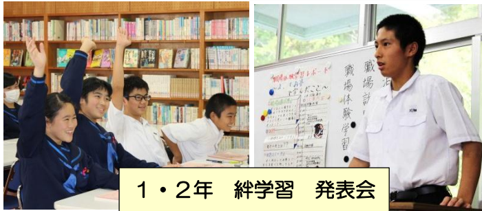
1・2年 絆学習 発表会