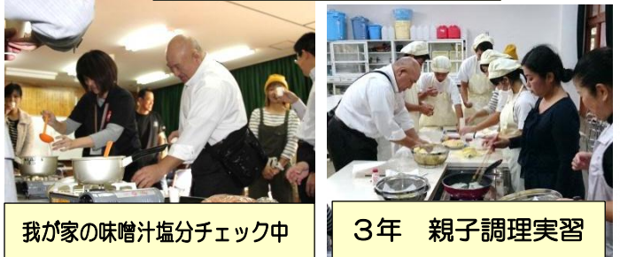
我が家の味噌汁塩分チェック中