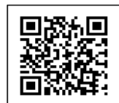
学校ホームページ