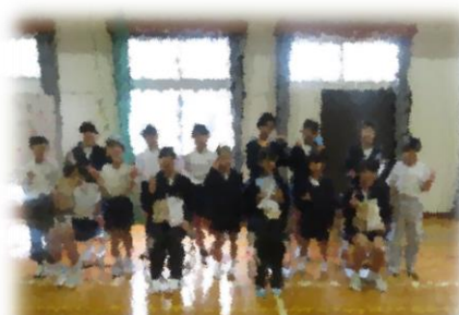
お別れ遠足 卒業式を終えて

4月からは新年度がスタートします。光あふれる春に向かって、子どもたちがどんな成長を見せてくれるのか楽しみです。今後とも手花部小学校の教育活動へのご理解とご協力をよろしくお願いいたします