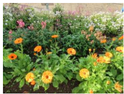
種からぐんぐん 育つキンセンカ